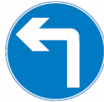
车辆 必须按照箭头指示 的方向转弯。