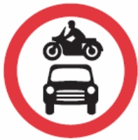
禁止机动车辆驶入。